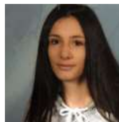
nouvelles étudiantes en contrat d'apprentissage au groupe scolaire.